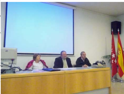
Última Asamblea de la AAHA en Madrid, 22.2.2012

Otras conferencias están programadas para después de verano en el mismo lugar y fecha y tocarán los movimientos de Yemen, Siria y Marruecos entre otros.