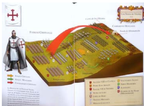
La batalla de las Navas según R.Sánchez sobre imagen de CIN, J.de las Heras: La Orden de Calatrava, M. 2008.

un paseo por la ciudad donde pernoctamos. Proseguimos con nuestra ruta militar musulmana: castillos de Baños de la Encina, Vilches.